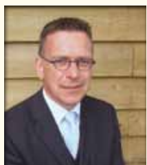
Johan Noord uitvaartverzorgers