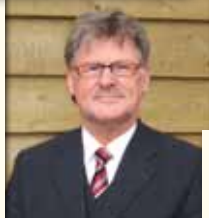
Roelof Smit uitvaartverzorgers